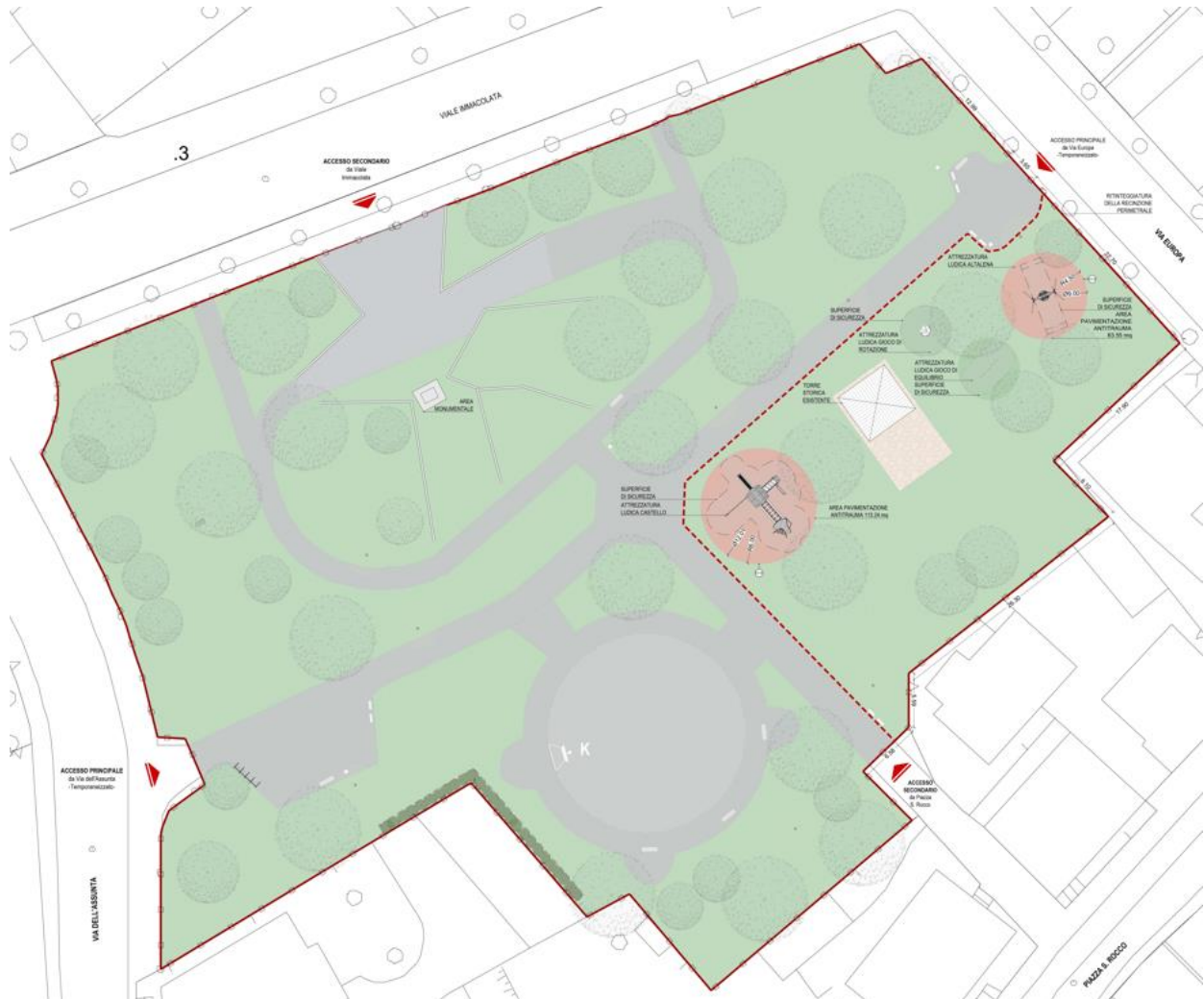
Figura 5 - Planimetria di Progetto