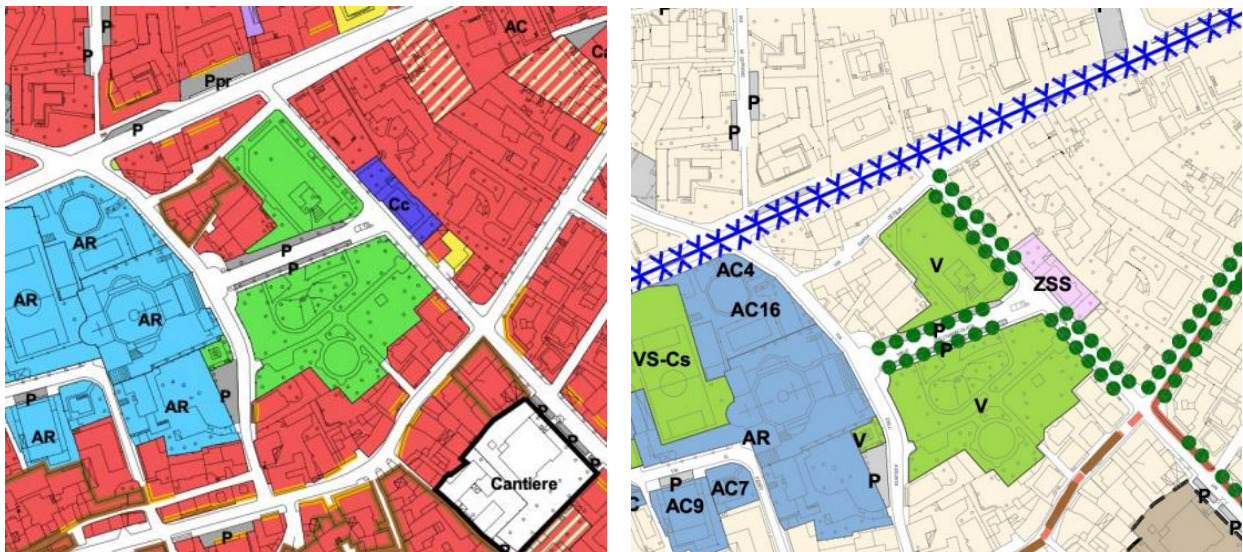
Figura 2: A sinistra estratto della Tav. QC1 "Uso del suolo urbano" del quadro conoscitivo, a destra estratto della Tav. PS1 "Progetto e programma per il sistema dei servizi" del PdS,

L'area oggetto di intervento, come indicato negli elaborati del Piano di Governo del Territorio (Variante puntuale al P.G.T. con adozione del 05.08.2021), è identificata come "verde di quartiere" (Tavola QC1 – Uso del Suolo Urbano del Quadro Conoscitivo) e "aree a verde attrezzato" (Tavola PS1 – Progetto e Programma per il sistema dei servizi del Piano dei Servizi), come da immagini di seguito riportate.