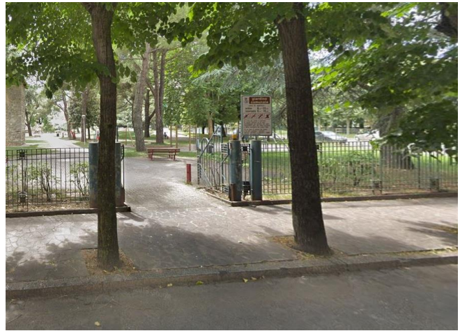
Figura 3 : A sinistra, ingresso da via Assunta. A destra, Ingresso da via Europa