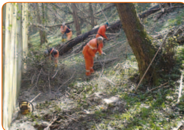
Volontari al lavoro nella zona sud-est del torrente Re

Accogliendo la richiesta dell'Assessorato all'Ambiente, il Gruppo di Protezione Civile ANA di Calusco si è prontamente attivato per mettere in calendario tale attività che si è svolta, con buoni risultati, sabato 29 marzo. I volontari, confluiti sul posto alle 7:30, hanno proceduto con due diverse squadre che hanno operato rispettivamente da Via S. Lorenzo fino al ponte del Re la prima e dal ponte del Re in direzione opposta, la seconda. Con l'intervento si sono trasferiti alla stazione ecologica ben nove autocarri di sfalci di vegetazione infestante e di potatura di alberi cadenti nell'alveo. Vale forse la pena rilevare che un buon quantitativo di tale materiale è frutto di potature effettuate da privati e abbandonate sul corso del torrente.