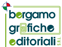
immagine coordinata aziendale, carta intestata, biglietti da visita, logotipi, marchi, depliant, brochure, cataloghi, notiziari comunali, illustrazioni, impaginazione di libri, riviste, stampe digitali, guide ai libri, cartoline, titoli, si può mettere nero su bianco...