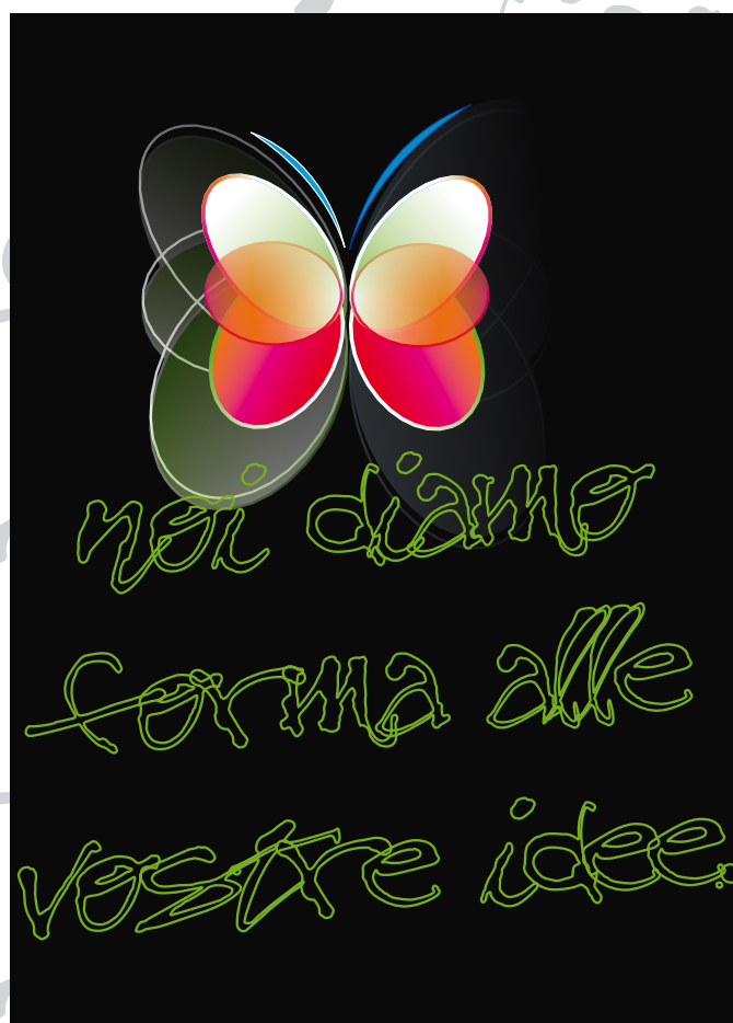
immagine coordinata aziendale, carta intestata, biglietti da visita, logotipi, marchi, depliant, brochure, cataloghi, notiziari comunali, illustrazioni, impaginazione di libri