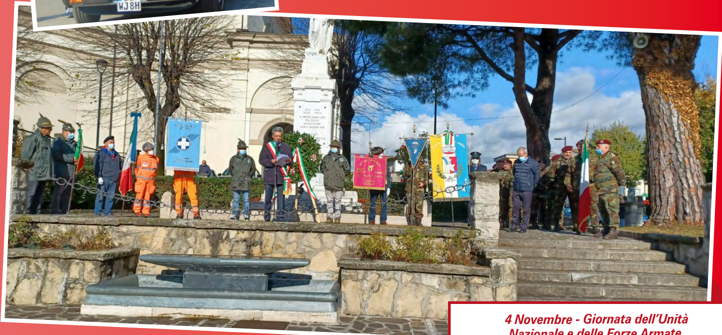
4 Novembre - Giornata dell'Unità Nazionale e delle Forze Armate