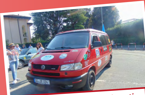
13 Settembre - Rally dei sei ponti