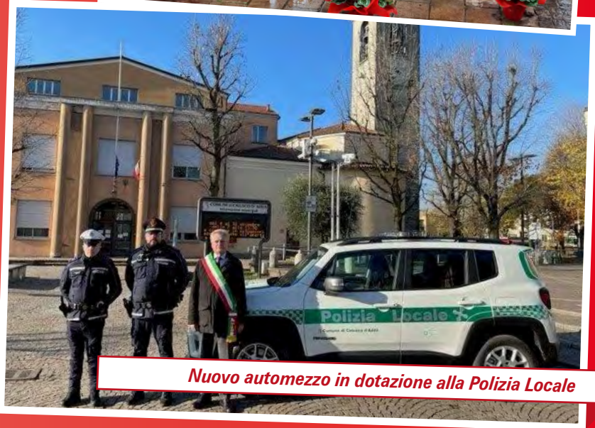
Nuovo automezzo in dotazione alla Polizia Locale