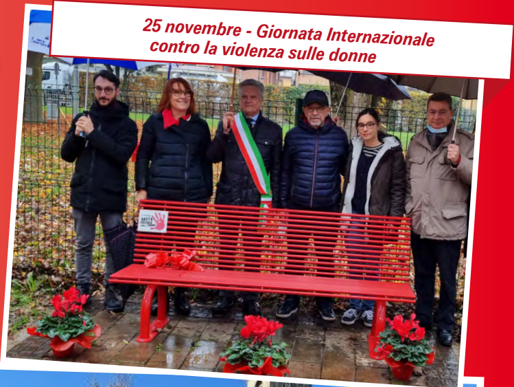
25 novembre - Giornata Internazionale contro la violenza sulle donne