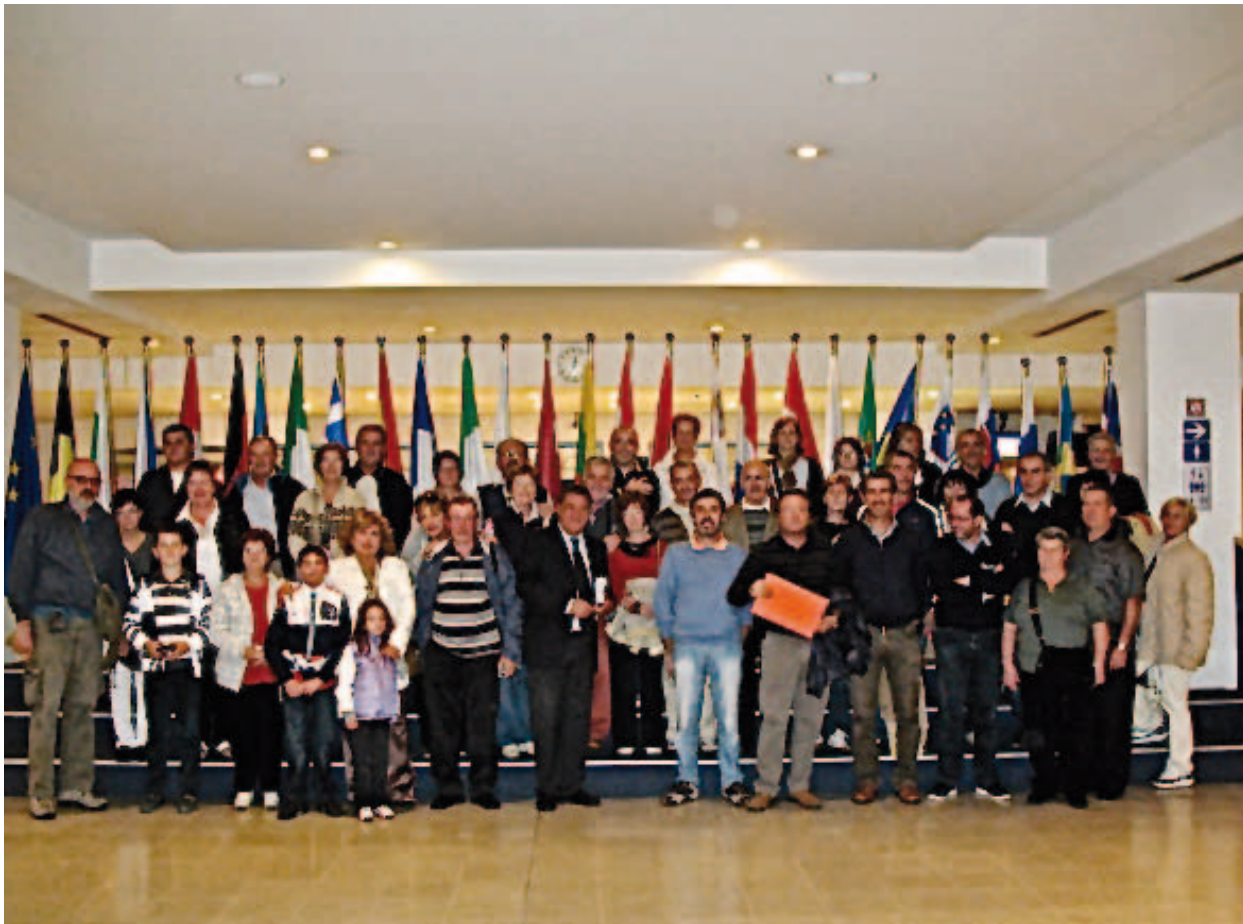
(Bruxelles: Parlamento Europeo)

A causa di un errore umano, ma soprattutto a causa della mancanza di sicurezza (le porte tagliafuoco erano in legno!), un incendio scoppiato in uno dei pozzi della miniera di carbon fossile del Bois du Cazier, causò la morte di 262 persone, su un