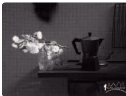
2° "Vaso di fiori"