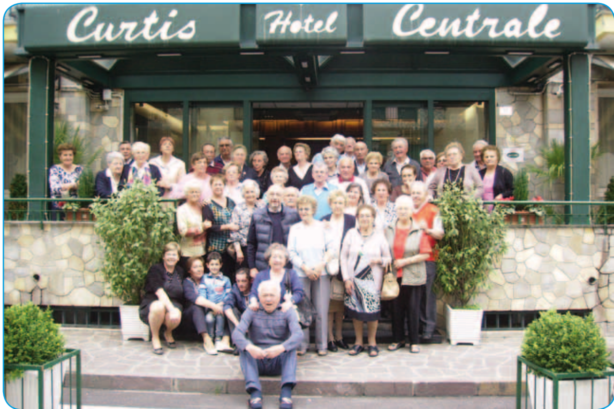
Soggiorno marino anziani 2014