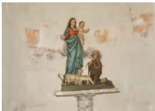
Rappresentazione iconografica dell'apparizione della Madonna della Guardia al pastore Pareto, custodita nell'Abbazia di San Fruttuoso a Camogli

Si è rinnovata, anche nel 2011, la tradizionale trasferta dei nostri anziani nella splendida località ligure di Alassio per un rilassante soggiorno marino. La breve visita effettuata, sabato 9 aprile, dal Sindaco e da alcuni componenti della Giunta è stata accolta da un gruppo in ottima forma, entusiasta per le belle giornate trascorse in piacevoli attività, alternate da momenti di relax e, soprattutto, accompagnate da un tempo splendido per quasi tutto il periodo. Proprio nella giornata della visita, era stata prenotata per il gruppo la visita al santuario della Madonna della Guardia con un comodo quanto divertente "trenino". In una delle immagini, si vede l'eccitato momento dell'imbarco. Dopo aver assistito alla partenza, tra auguri di buona gita e di buon proseguimento del soggiorno, la delegazione in visita ha fatto ritorno a Calusco.