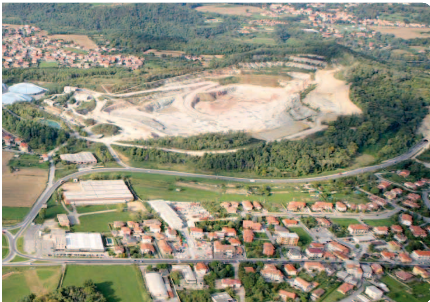
Panoramica di Calusco d'Adda