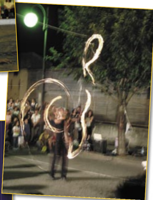
2° premio di Euro 200,00. = al Sig. Stefano Vimercati per la foto "Segni di fuoco"