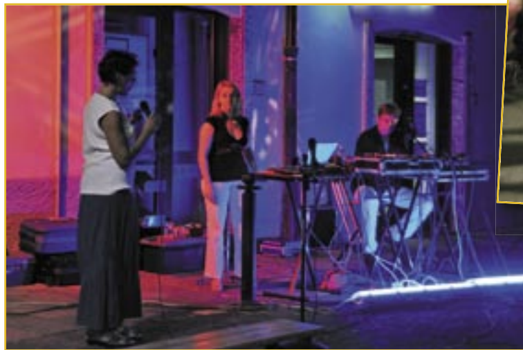
3° premio di Euro 100,00. = alla Sig.ra Marina Parma per la foto "Notte bianca, rossa e blu"